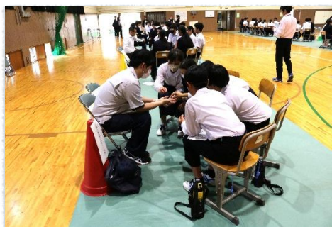
興味深く製品を覗き込む生徒