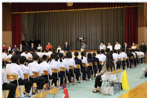
働く先輩たちから20秒あいさつ