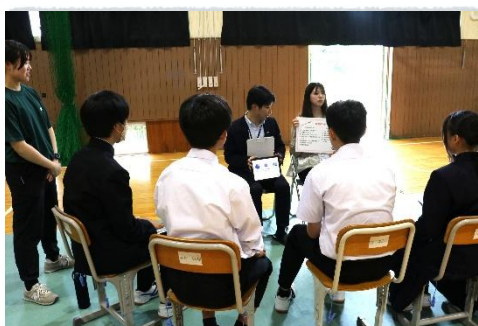
質問ボードに沿って対話する様子