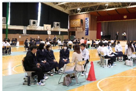
熱心に話を聞く生徒たち