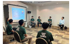
プログラムキックオフ（R5.7.21）には、兵庫県知事 齋藤元彦も参加し意見交換

【主催】 兵庫県 【運営】 株式会社みなと銀行 地域戦略部、一般社団法人ベンチャー型事業承継