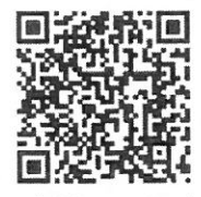
▲豊岡市ホームページ

【問合せ先】豊岡市役所 環境経済課 経済政策係 TEL : 0796-23-4480 Mail : ecovalley@city.toyooka.lg.jp